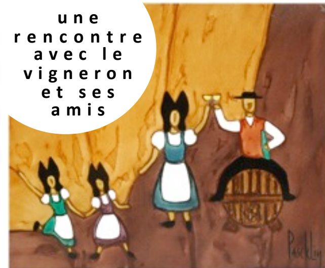
exposition des dernières peintures alsatiques de PASCKLIN

une rencontre avec le vigneron et ses amis